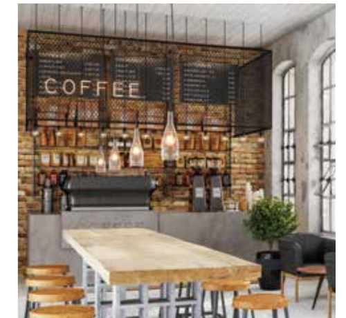
Ristoranti, bar e mense