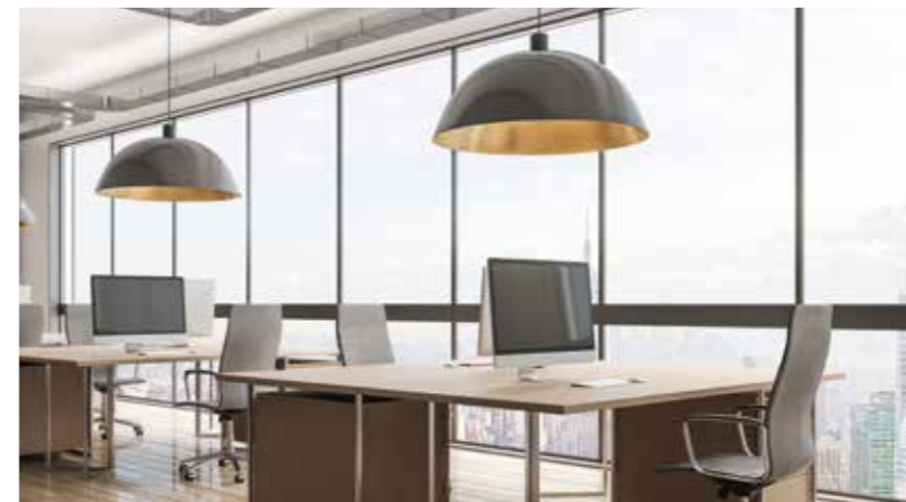
Uffici, sale riunioni, studi professionali