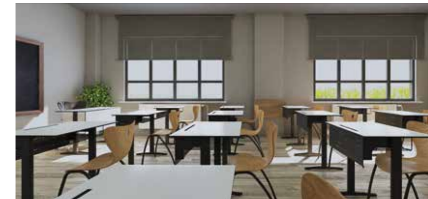
Università, scuole e asili